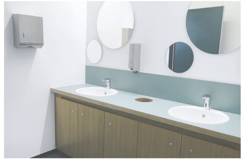
Das Skelett des Gebäudes wurde aus Stahlbeton errichtet. Große Glasflächen garantieren helle, gemütliche Räumlichkeiten. Auch die Sanitäranlagen sind ansprechend und funktionell gestaltet.

→ Die Produkte werden im Cook & Chill Verfahren in der hauseigenen Manufaktur produziert und durch verschiedene Service-Bund-Partner an die jeweiligen Standorte ausgeliefert. Vor Ort in Trossingen wird fertig gegart und in der Mensa ausgegeben. Bestellt wird im Voraus online, bezahlt wird bei der Ausgabe einfach und bargeldlos mit dem Chip.