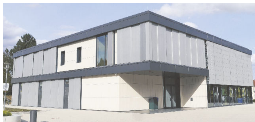
Der Neubau bildet das Verbindungsstück zwischen Gymnasium und Realschule.