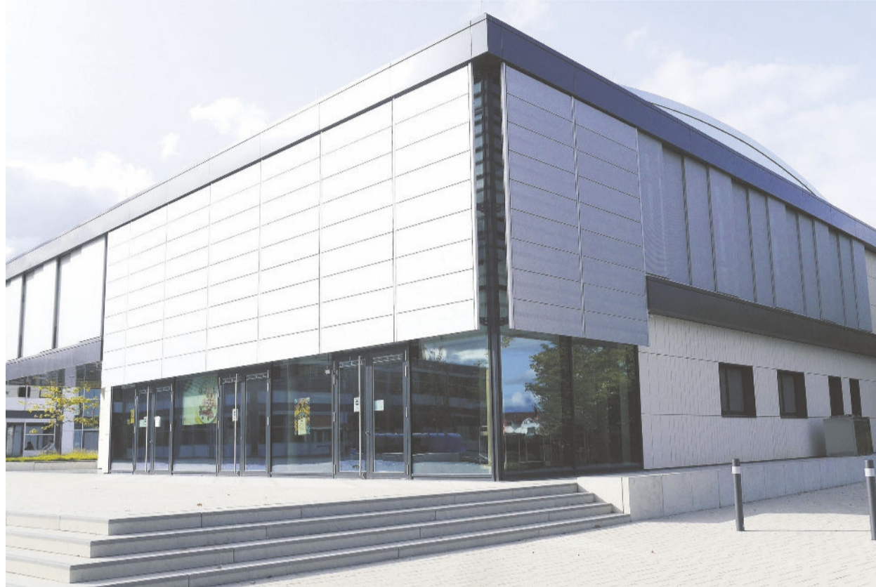
Das Ganztagszentrum hat viel unter einem Dach zu bieten: Neben Mensa, Bücherei und Aufenthaltsbereichen befinden sich auch Arbeitsplätze.

„Mensa, Bücherei, Aufenthaltsbereiche und Arbeitsplätze bieten alles, was man heute von einem modernen Schulbau erwartet. Wir haben hier hochwertig gebaut und ein erstes ech-