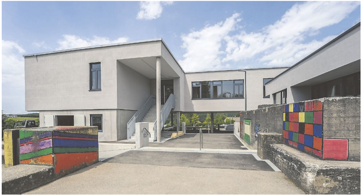
Das Schulgebäude wurde in drei Schritten nach und nach saniert.

Zudem sind die Räume auf dem neuesten Stand der Technik. Im Zuge der Umbaumaßnahmen wurde außerdem ein Aufzug eingebaut, somit ist die Schule barrierefrei. Die Bauarbeiten