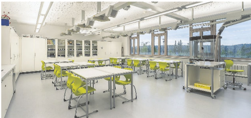
Die neuen Klassenzimmer und Fachräume bieten modernstes Inventar für die Schülerinnen und Schüler der Niedereschacher Gemeinschaftsschule.

fanden meist im laufenden Betrieb statt, und die Zusammenarbeit der meist regionalen Firmen funktionierte optimal.